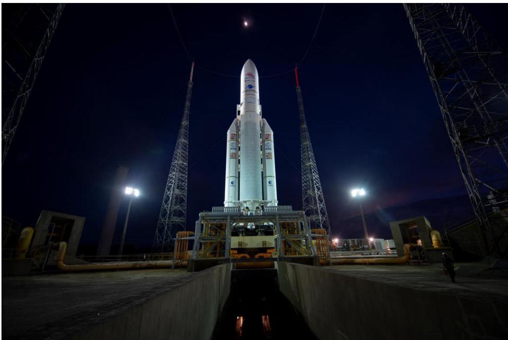
Oppskytninger fra Guiana Space Centre er midlertidig stanset.